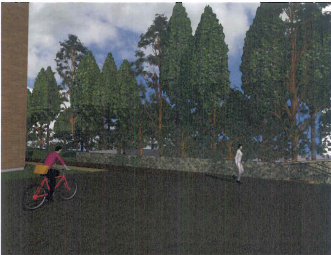
Figur 1 Fremtidige forhold

Dansk Regnvandsstyring ApS agtparken 175 :harlottenlund