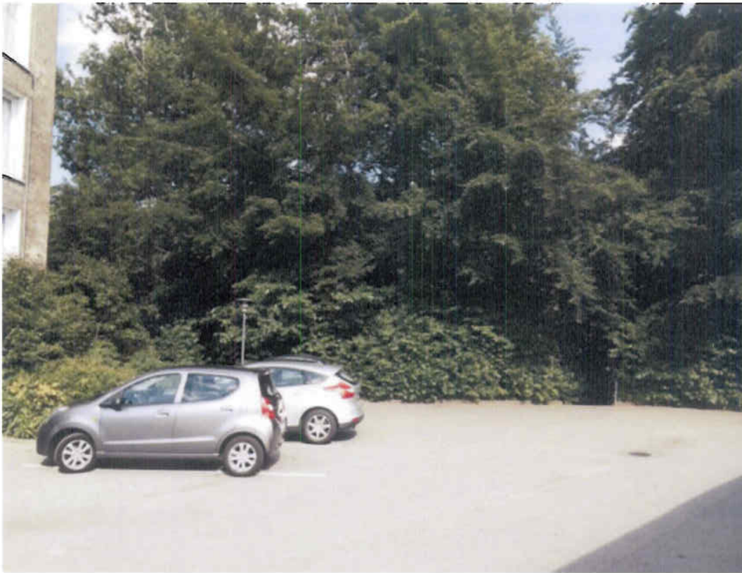
Figur 2 Eksisterende forhold